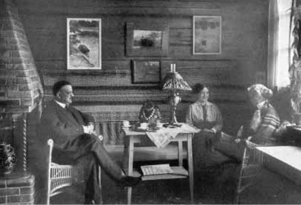
Sibelius 1905 mit Frau und Tochter im nationalfinnischen Ambiente seiner Villa „Ainola“ bei Järvenpää