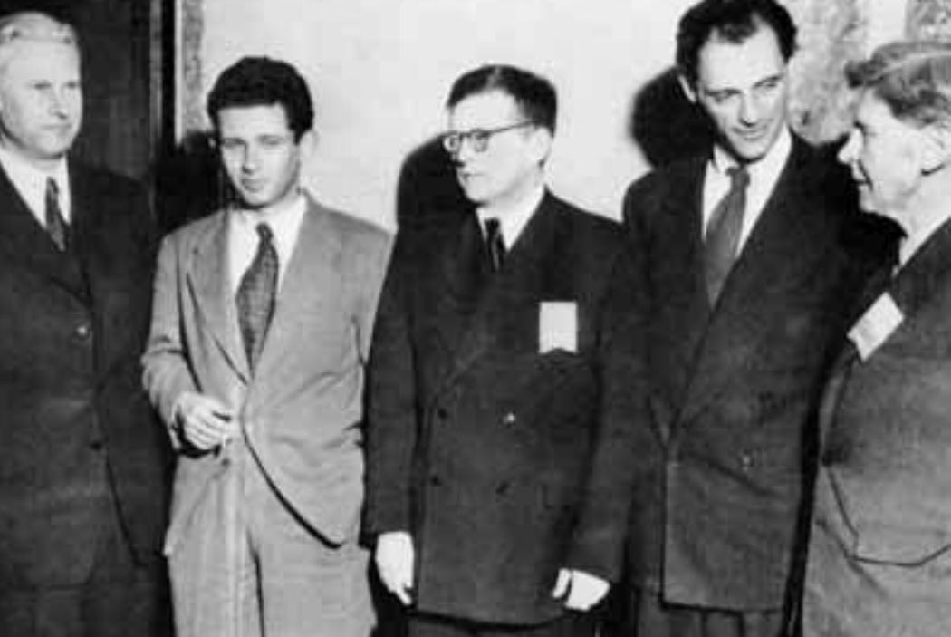
Shostakowitsch neben Norman Mailer (2. von links) und Arthur Miller (2. von rechts) auf dem Weltfriedenskongress 1949 in New York