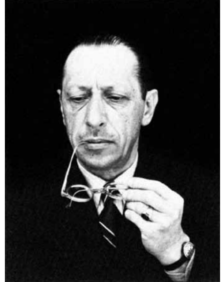
Der nachdenkliche Igor Strawinsky, photographiert von Edward Weston (1935)

Bloch, aber ohne Anklänge an die Synagoge?“ Ich will auf die gespielte oder wirkliche Unkenntnis dieses Herrn nicht weiter eingehen, er scheint nicht zu wissen, dass seit zweitausend Jahren die Psalmen nicht mehr an die Synagoge gebunden sind, sondern die Grundlage der Gebete, Predigten und Gesänge der christlichen Kirche bilden. Aber enthüllt diese Frage nicht eine Gesinnung, der man in unserer Zeit immer häufiger begegnet? Offensichtlich haben diese Leute verlernt, die Texte der Heiligen Schrift anders als vom ethnologischen, historischen oder pittoresken Standpunkt aus anzusehen. Dass man sich von den Psalmen anregen lassen kann, ohne an diese Gesichtspunkte zu denken, scheint ihnen erstaunlich, und sie fühlen sich veranlasst, nach Erklärungen zu forschen. Aber dass ein Jazz „Alleluia“ genannt wird, finden sie durchaus natürlich. All diese Missverständnisse entstehen dadurch, dass diese Leute in der Musik immer etwas anderes als Musik finden wollen. Für sie ist es wichtig