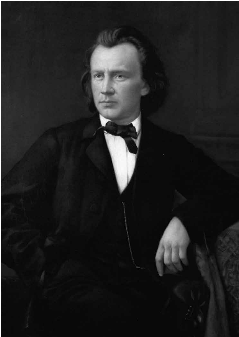
Carl Jagemann: Johannes Brahms (1867)