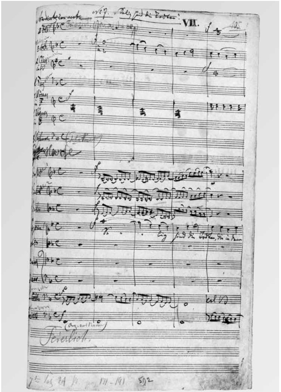
Der Anfang des 7. Satzes („Selig sind die Toten“) in Brahms' Handschrift