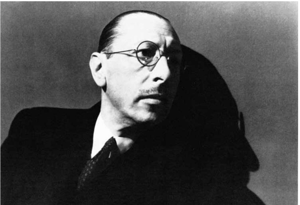
Igor Stravinsky fotografiert von George Hoyningen-Huené (1934)