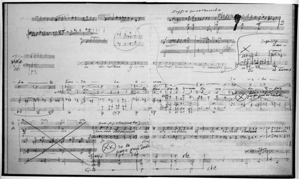
„Symphonie de Psalms“, Partiturskizze des 3. Satzes: „Laudate Dominum“

Anlass mit dem lang gehegten (inneren) Wunsch, einmal ein größeres geistliches Werk zu schreiben. Dazu wählte er Texte verschiedenen Inhalts aus den Psalmen König Davids aus: den Bußpsalm 38 (Verse 13 und 14), den Dankpsalm 39 (Verse 2, 3 und 4) sowie den ganzen 150. Psalm – jenes berühmte Lobgedicht, das zur Verherrlichung Gottes durch die Musik aufruft. Strawinskys ursprünglicher Plan, die Psalmen in einer alten russischen Übersetzung zu vertonen, wurde bald wieder aufgegeben, und stattdessen legte er seiner Komposition die lateinische Fassung der „Vulgata“ zugrunde.