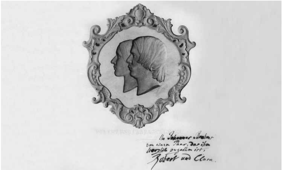
Radierung von Friedrich Schauer: Robert und Clara Schumann – mit persönlicher Widmung

Stücke ebenso wie Brahms' Requiem auf frei zusammengestellten Bibelsprüchen bzw. – im Fall von Händels Komposition – auf Bibelparaphrasen. Darin unterscheiden sich die evangelischen Trauerkompositionen von den katholischen, die in einen festen Ritus eingebunden sind und daher stets auf denselben liturgischen Worten beruhen. Gleichwohl stand auch das Requiem-Modell der römischen Kirche bei Brahms Pate: Nicht nur hinsichtlich des Namens, sondern auch bezüglich der dramaturgischen Konzeption und – auf eine sehr subtile und latente Weise – der melodischen Gestaltung.