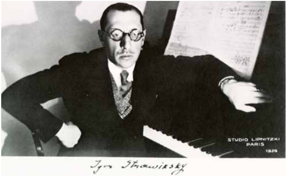
Igor Stravinsky am Klavier (1929)