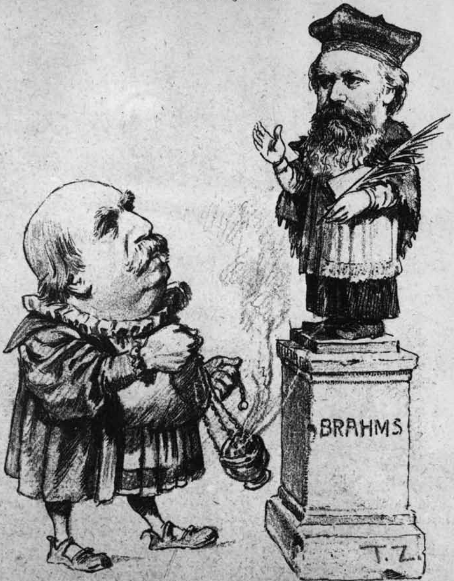
„Eduard Hanslick beweihräuchert die Statue des Heiligen Johannes Brahms“ Karrikatur aus der satirischen Zeitschrift „Figaro“