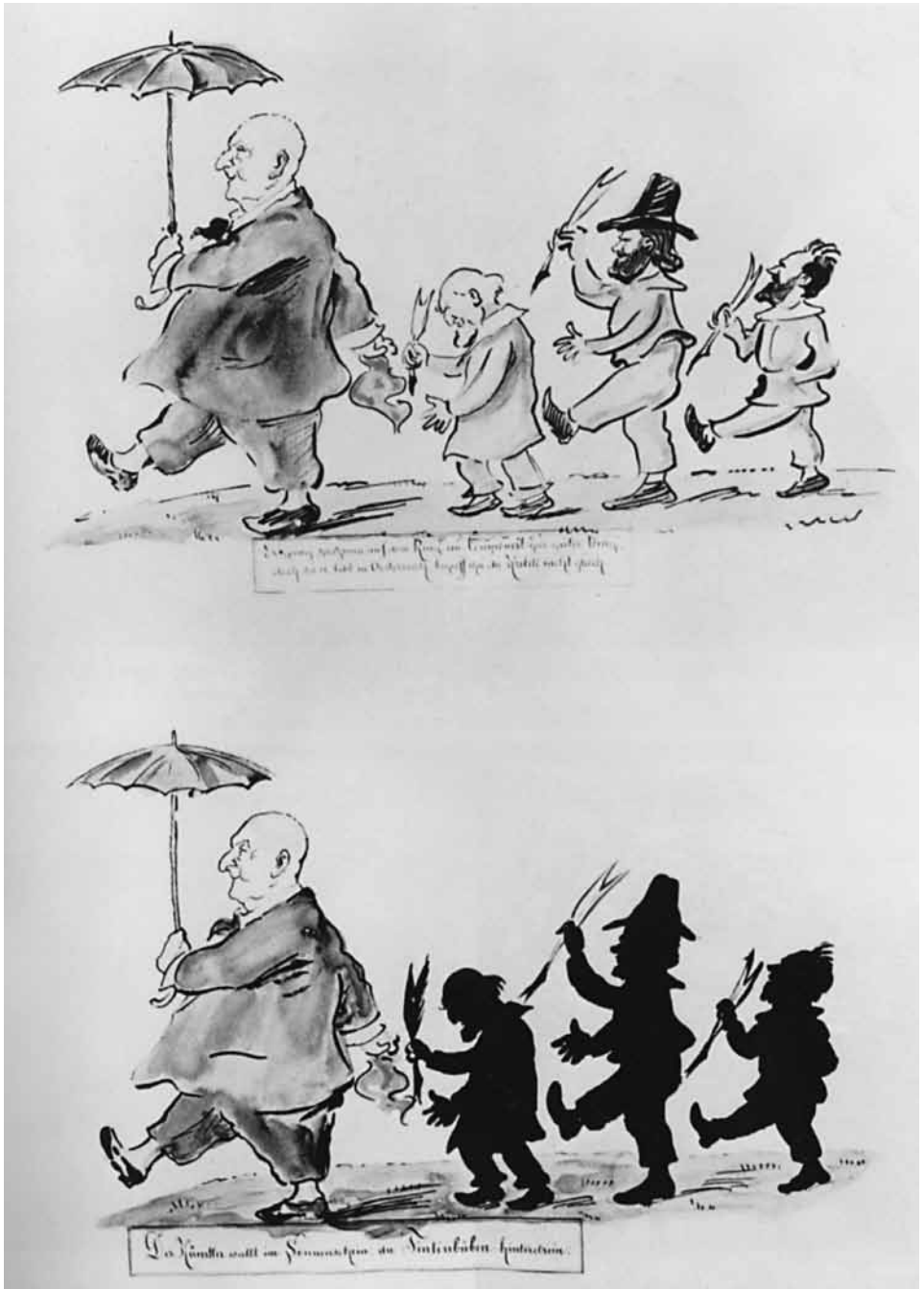
Otto Böhlér: Anton Bruckner gefolgt von den Wiener Kritikern Eduard Hanslick, Max Kalbeck und Richard Heuberger (1890)