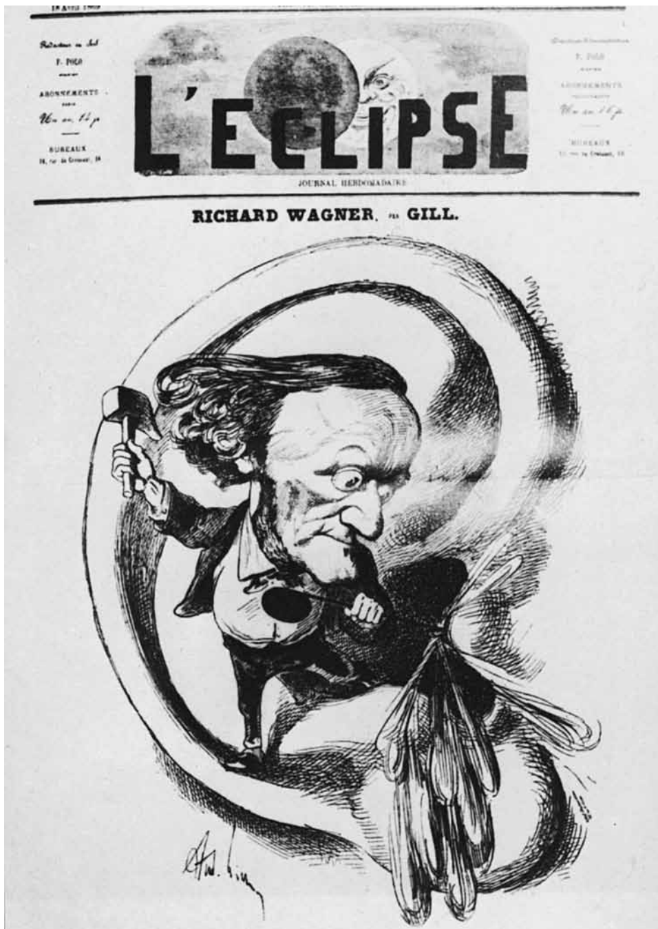
In der satirischen Zeitschrift „L'Éclipse“ maltrahiert der Komponist des „Tristan“ genüsslich die Ohren seiner Zuhörer (1869)