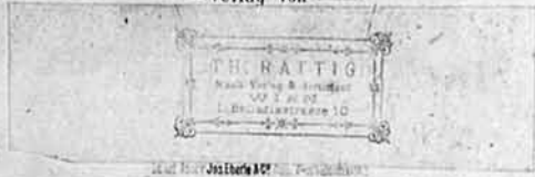
Titelblatt des von Gustav Mahler arrangierten vierhändigen Klavierauszugs