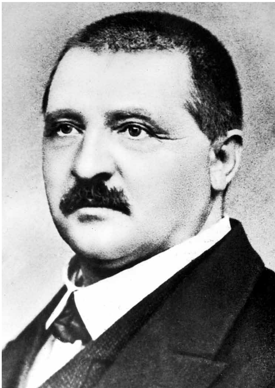
Anton Bruckner (1872)