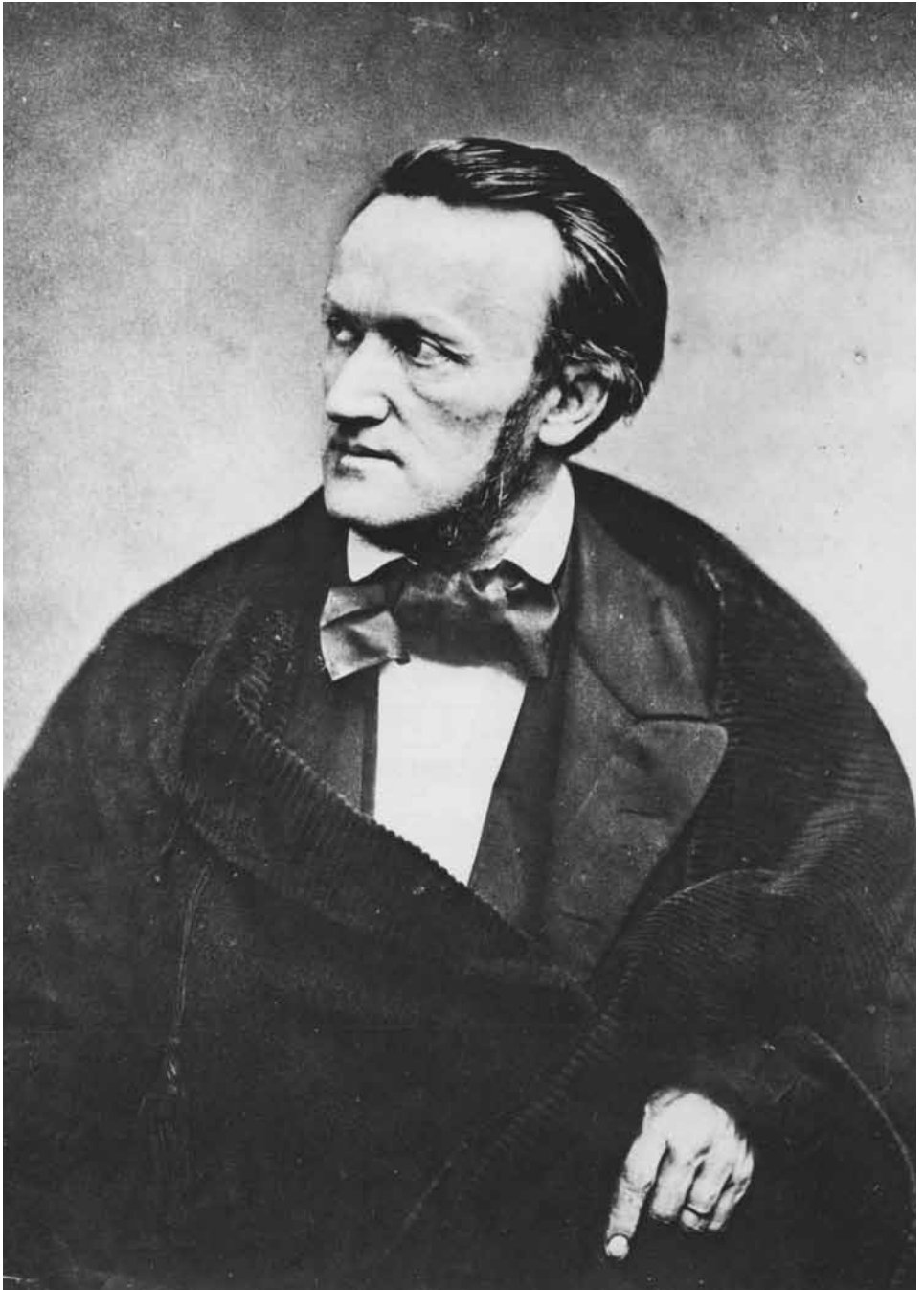
Richard Wagner im Pariser Studio „Petit et Trinquart“ (1860)