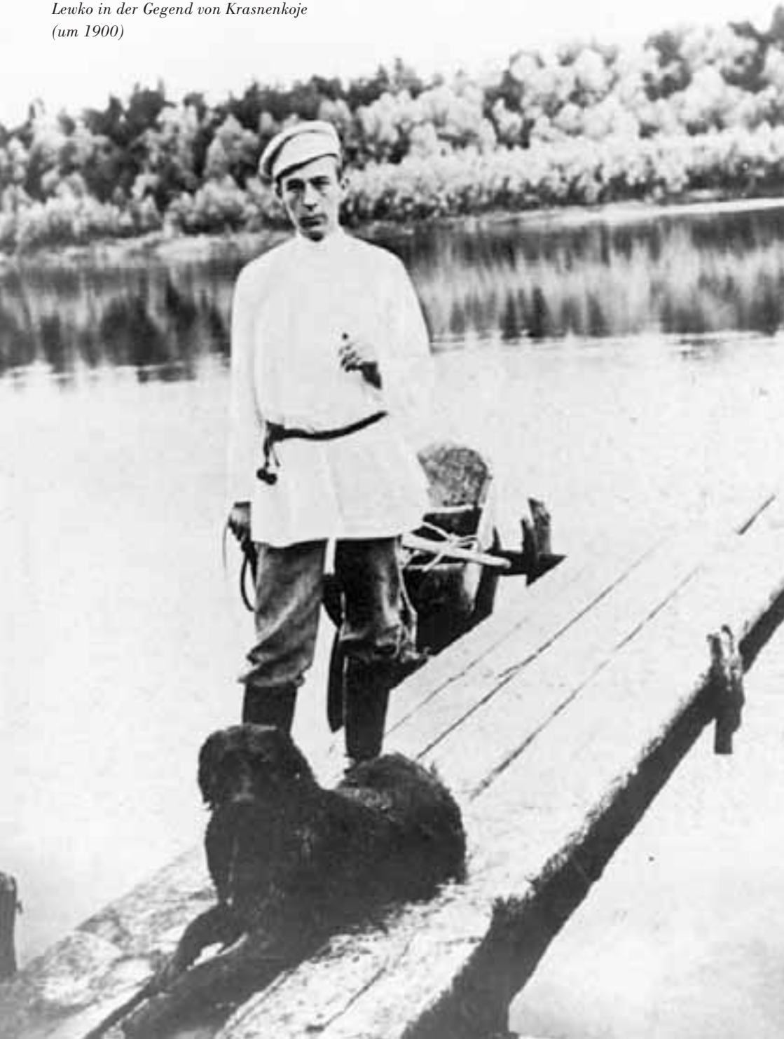
Sergej Rachmaninow mit seinem Hund Lewko in der Gegend von Krasnenkoje (um 1900)