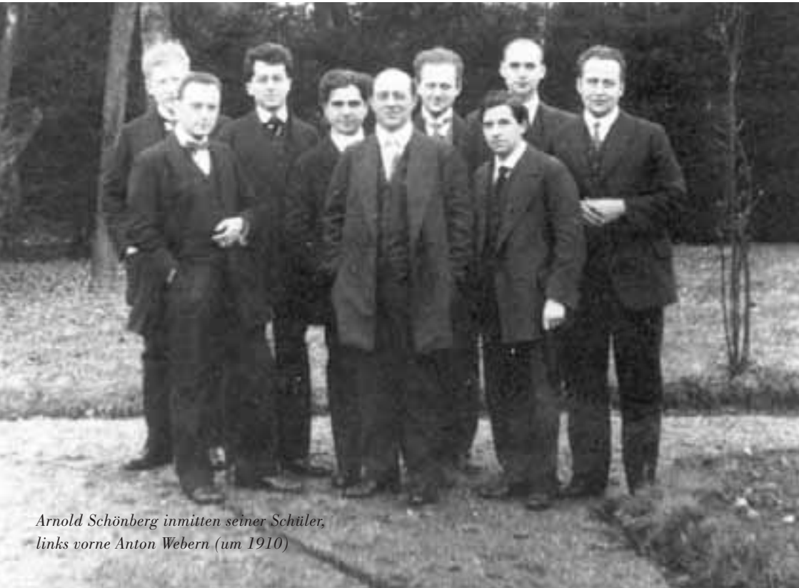
Arnold Schönberg inmitten seiner Schüler, links vorne Anton Webern (um 1910)

am Rande der Stille: Unmerklich leise hebt es an, um am Ende wieder im Schweigen zu versinken. „Bis zu gänzlicher Unhörbarkeit“, lautet die letzte Vortragsbezeichnung. Bei allem Temperament und Kontrastreichtum sind es gerade diese Anweisungen in der Partitur – „sehr zart“, „kaum hörbar“, „zögernd“, „mit zartem Ausdruck“, „sehr leise und zart“, „so zart als möglich“ – , die den Charakter der Komposition bestimmen. Der tiefere Sinn erschließt sich aus Bruno Willes Gedicht: „Weißt du, sinnende Seele, / Was selig macht ? / Unendliche Ruhe ! / [...] Friede, Friede / Im Lerchenliede, / In Windeswogen, / In Ährenwogen !“