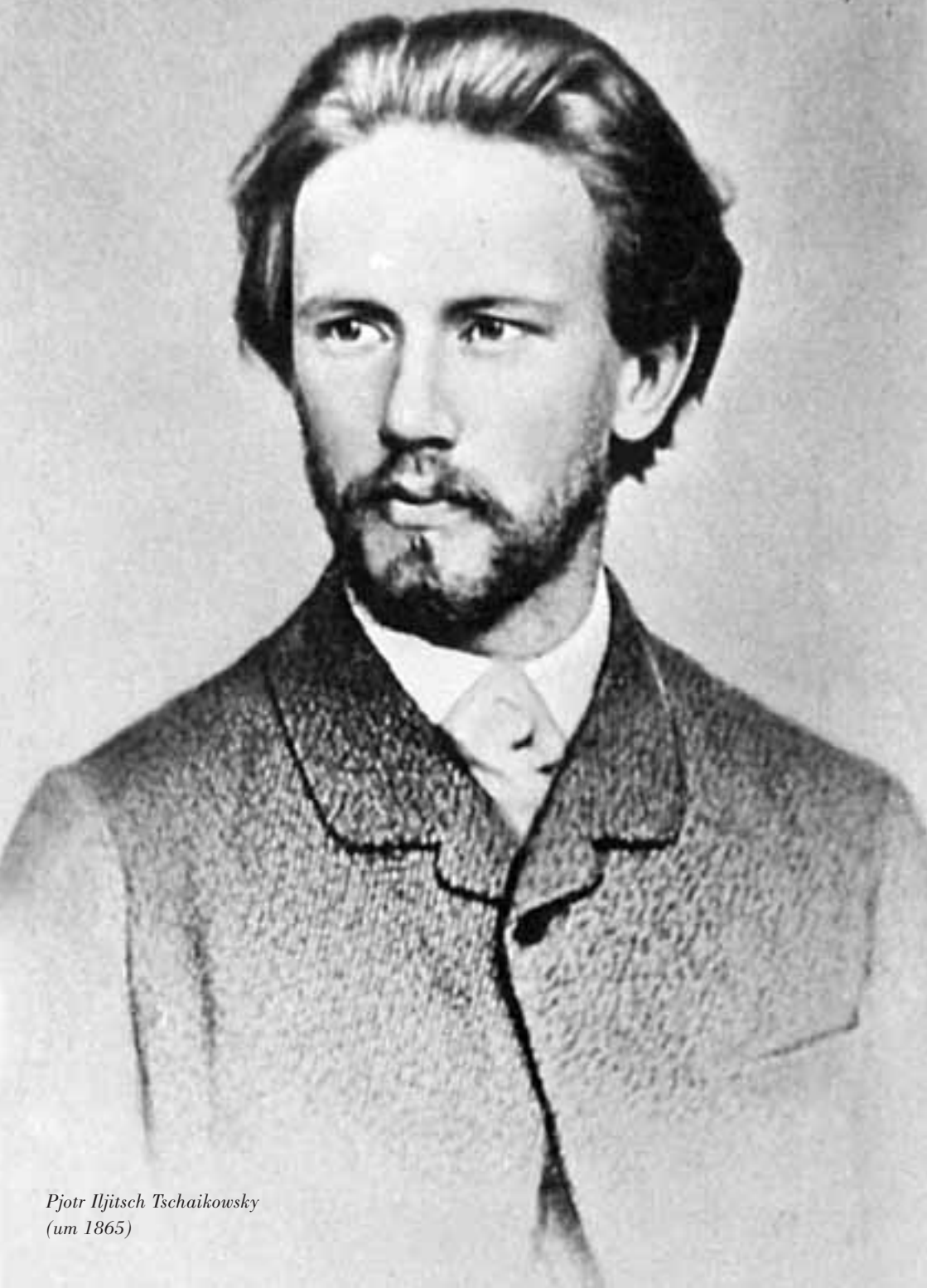
Pyotr Iljitsch Tschaikowsky (um 1865)