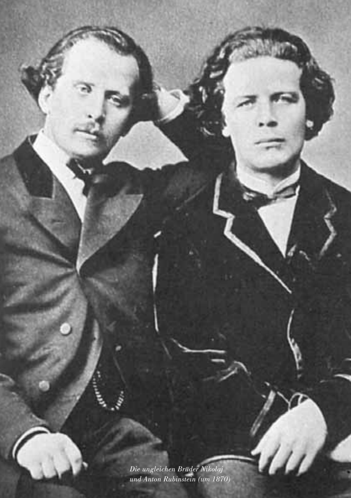
Die ungleichen Brüder Nikolaj und Anton Rubinstein (um 1870)