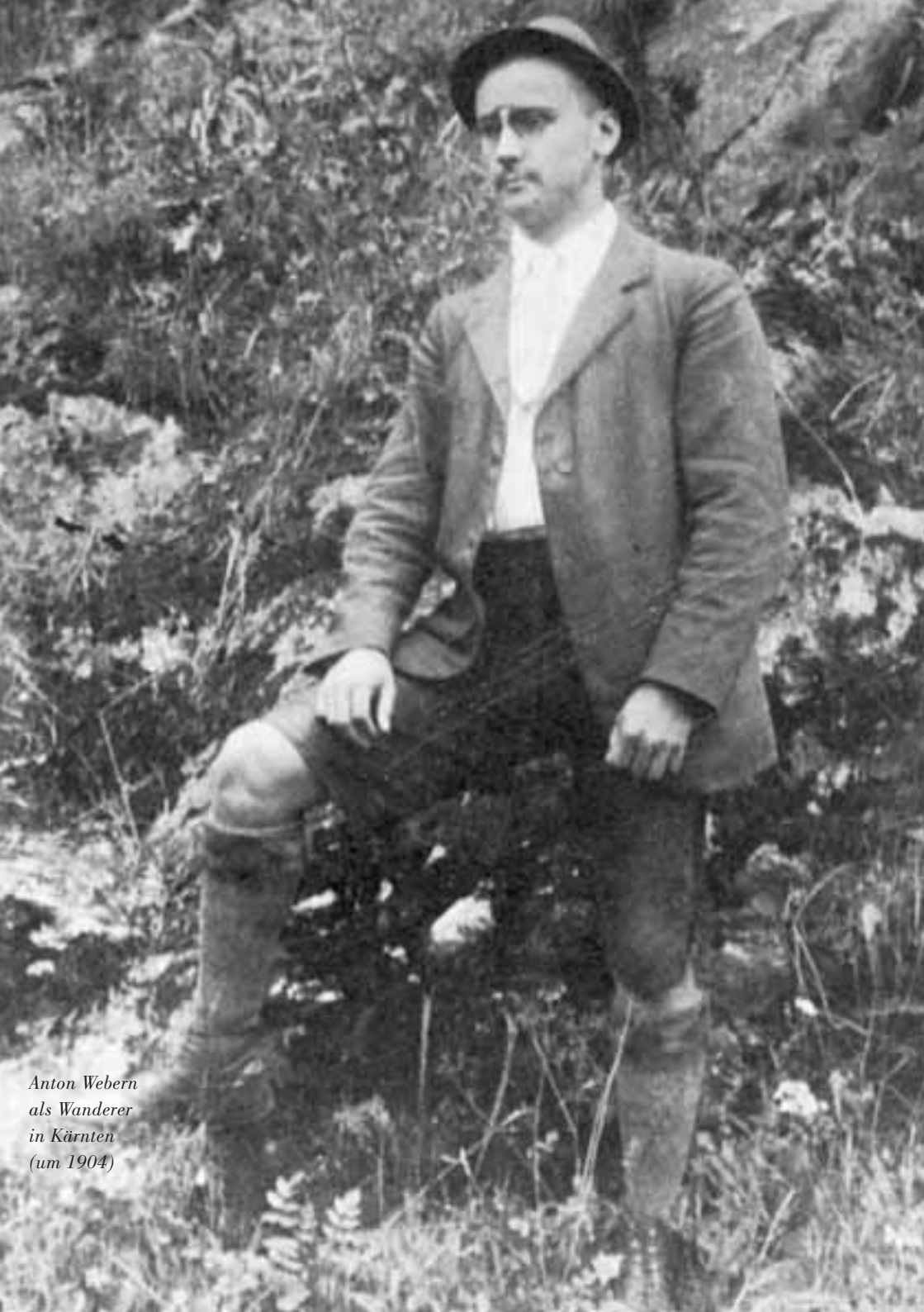
Anton Webern als Wanderer in Kärnten (um 1904)