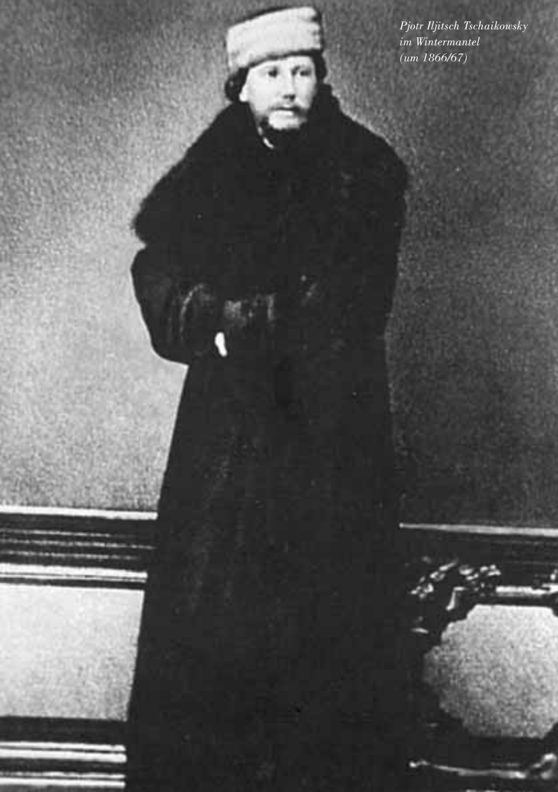
Pjotr Iljitsch Tschaikowsky im Wintermantel (um 1866/67)