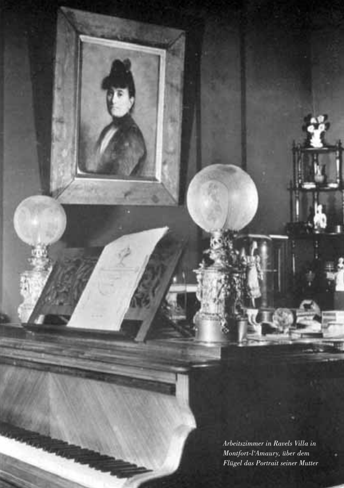
Arbeitszimmer in Ravels Villa in Montfort-l'Amaury, über dem Flügel das Portrait seiner Mutter