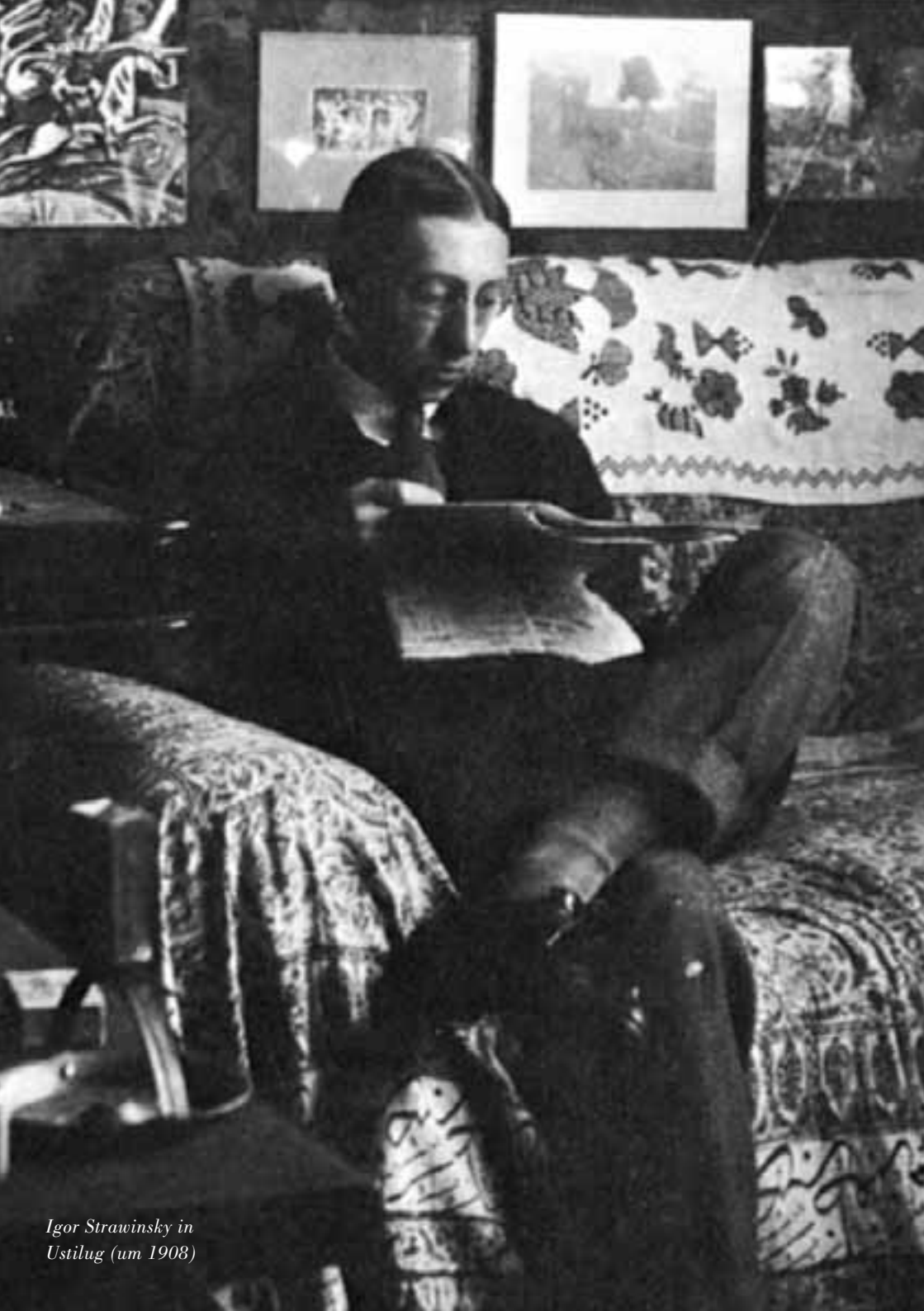
Igor Stravinsky in Ustilug (um 1908)