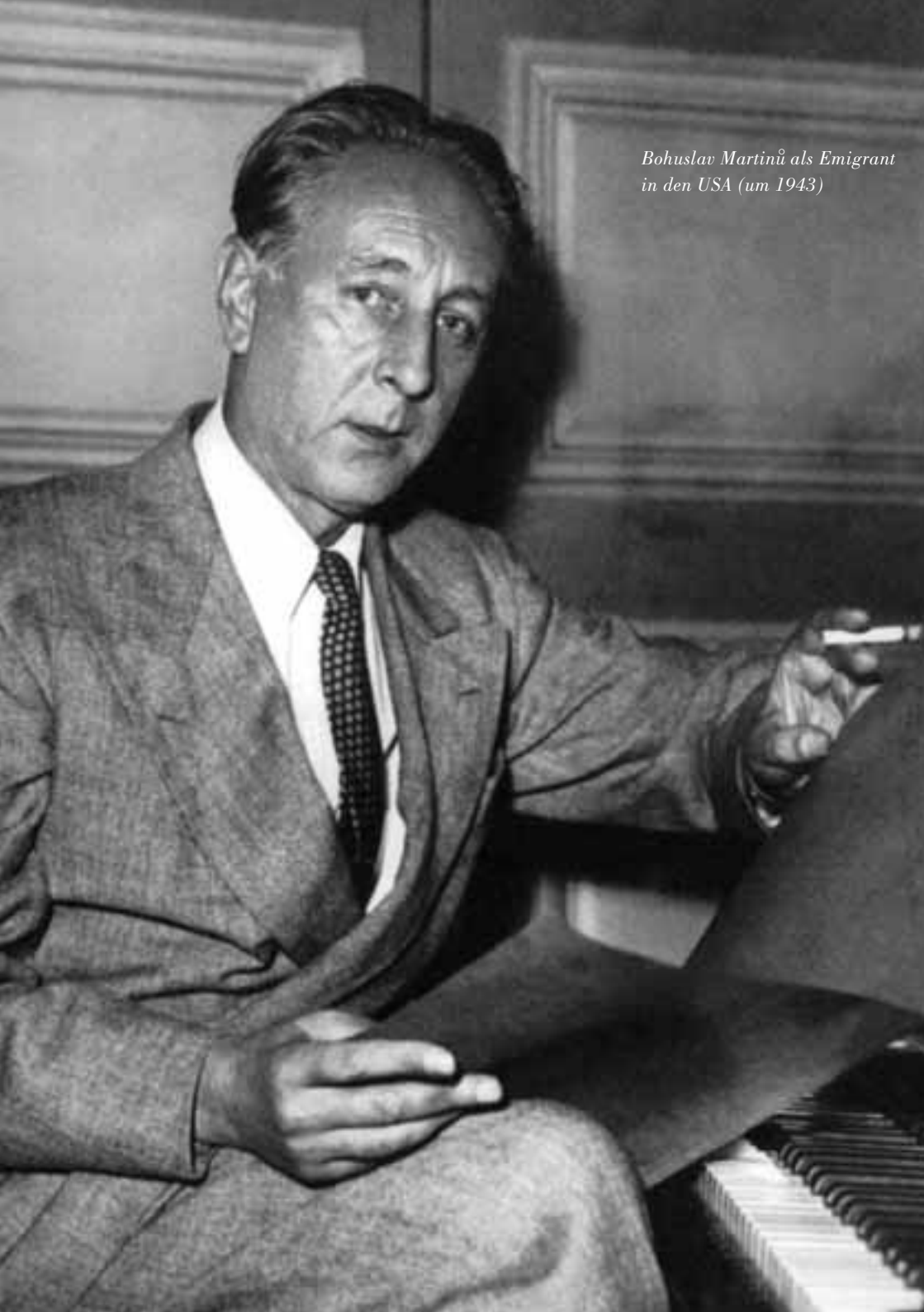
Bohuslav Martinů als Emigrant in den USA (um 1943)