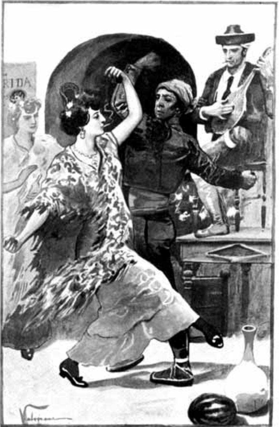
Zeitgenössische Illustration zu einem traditionell getanzten Bolero (um 1920)