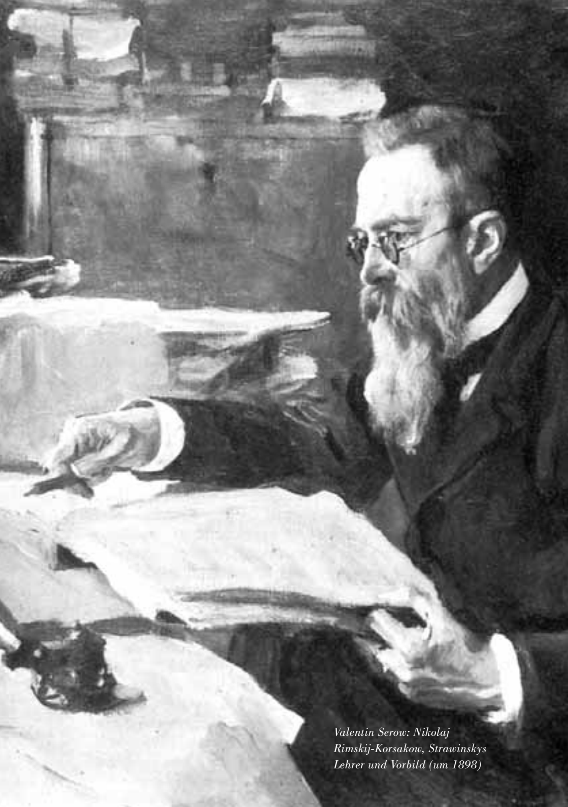
Valentin Serov: Nikolaj Rimskij-Korsakov, Stravinskys Lehrer und Vorbild (um 1898)