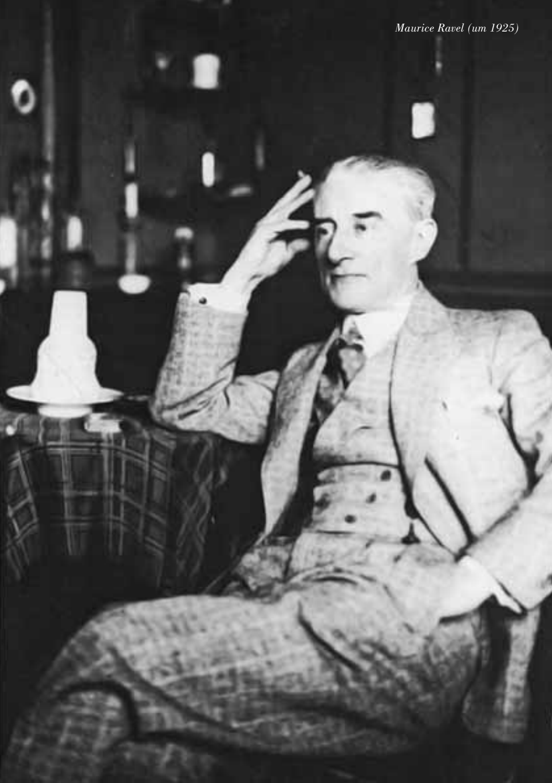
Maurice Ravel (um 1925)