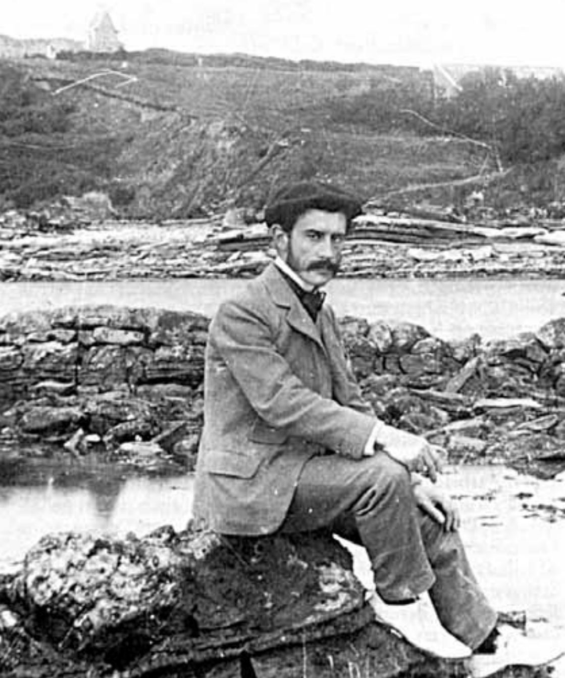
Maurice Ravel in den Pyrenäen (um 1901)