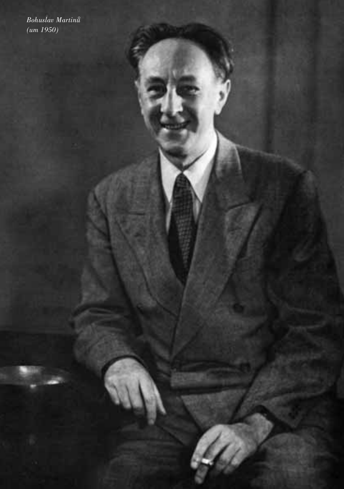
Bohuslav Martinů (um 1950)