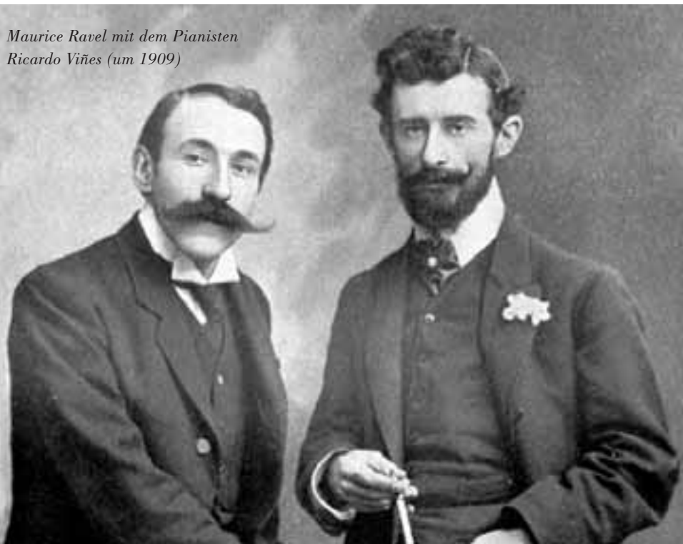
Maurice Ravel mit dem Pianisten Ricardo Viñes (um 1909)