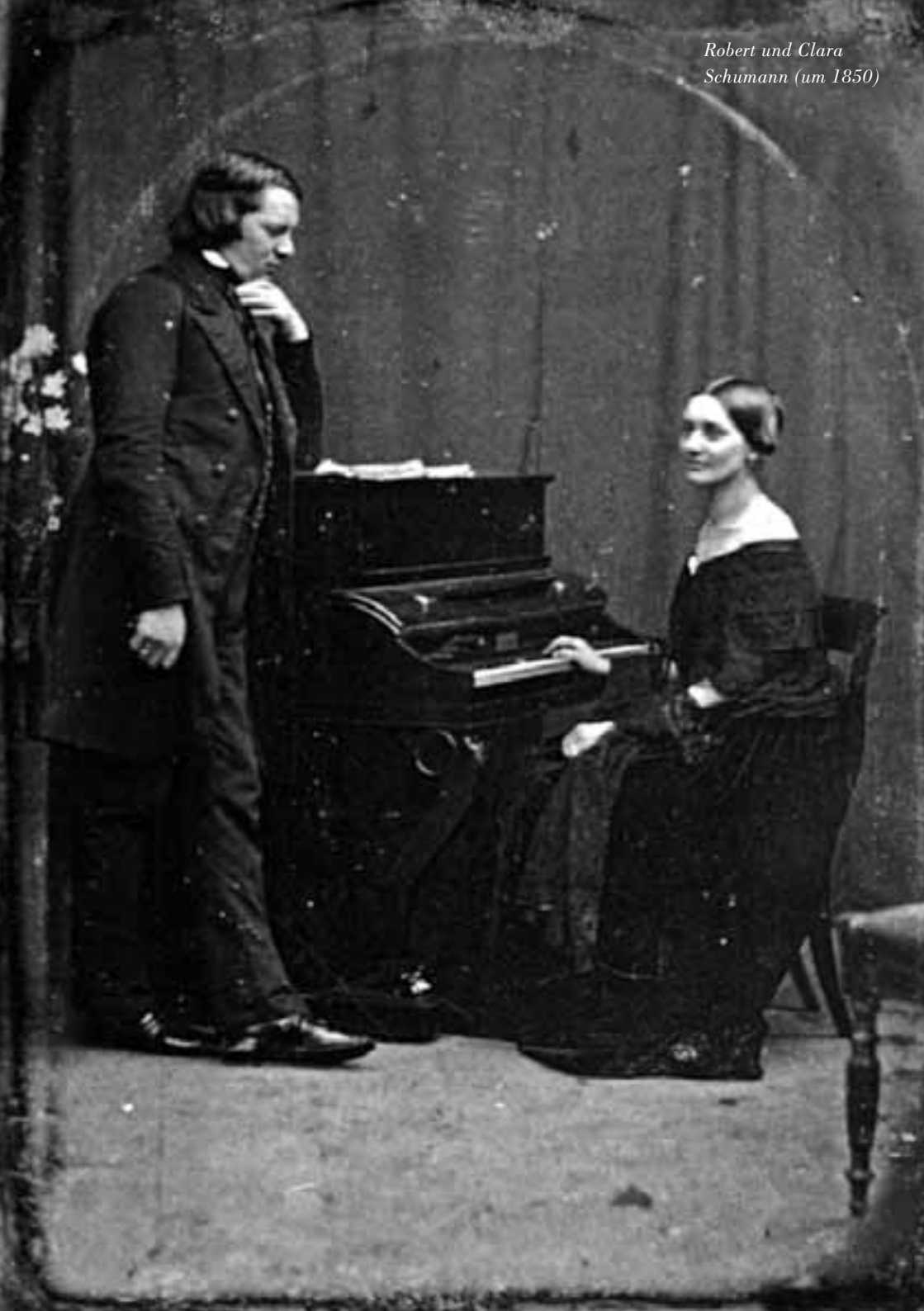
Robert und Clara Schumann (um 1850)