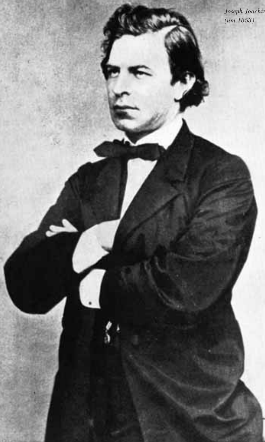
Joseph Joachim (um 1853)