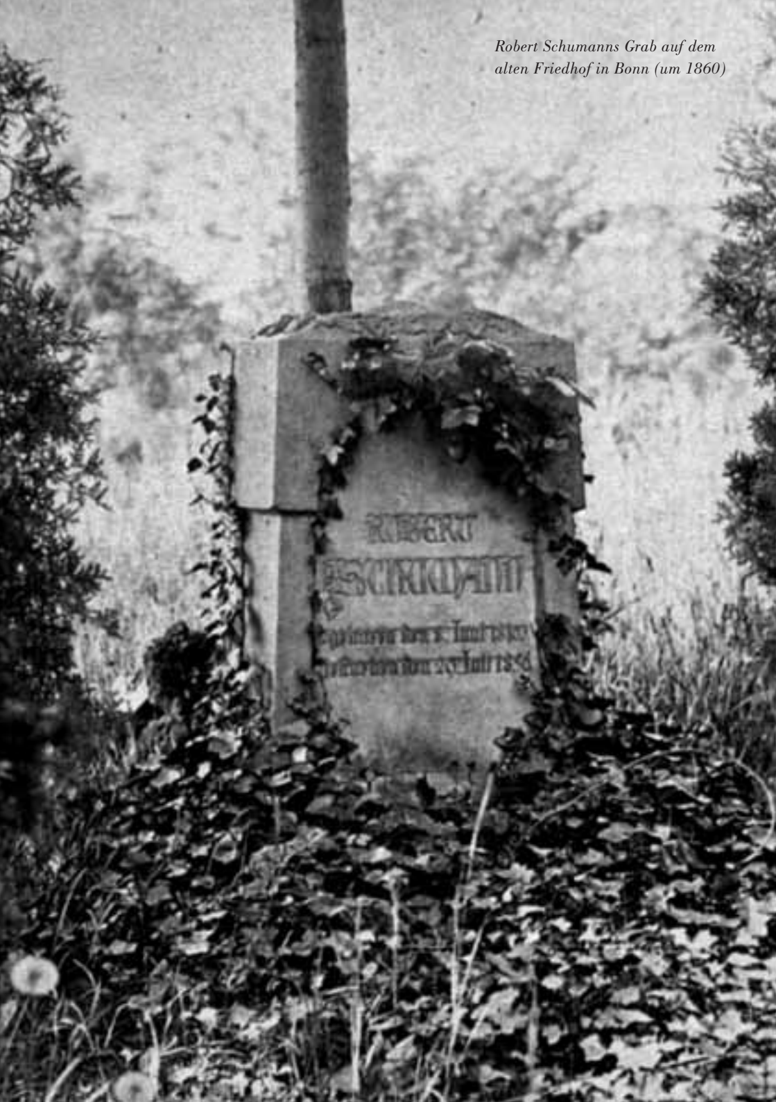
Robert Schumanns Grab auf dem alten Friedhof in Bonn (um 1860)