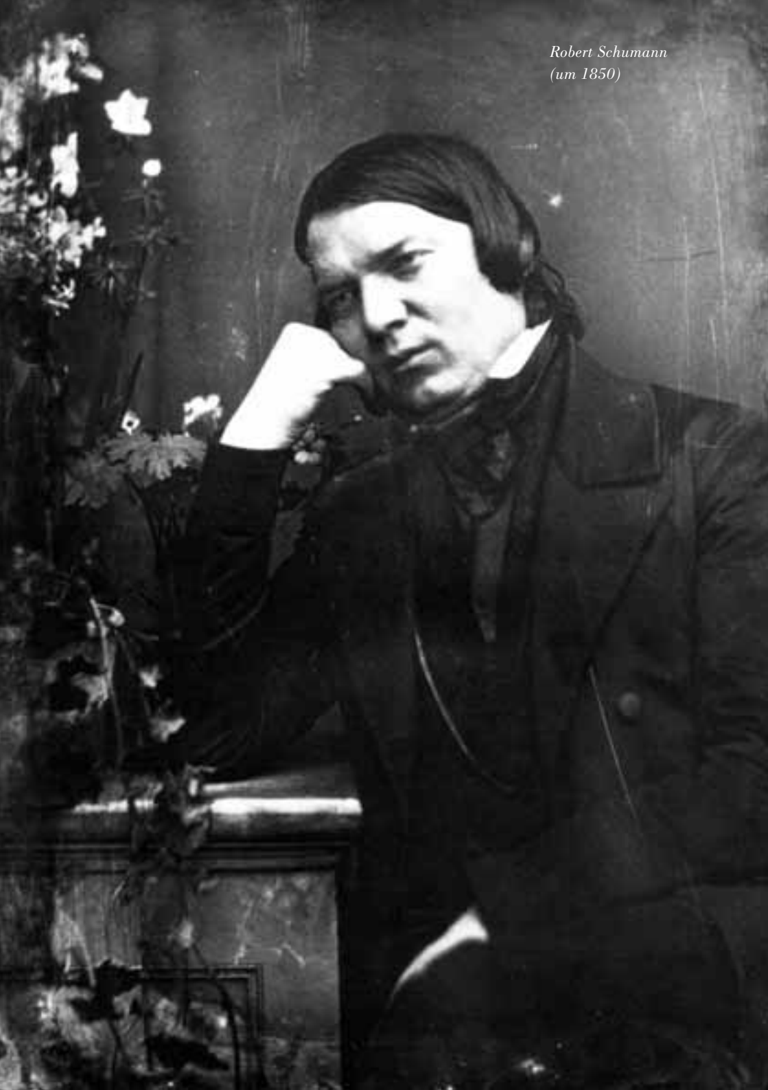
Robert Schumann (um 1850)