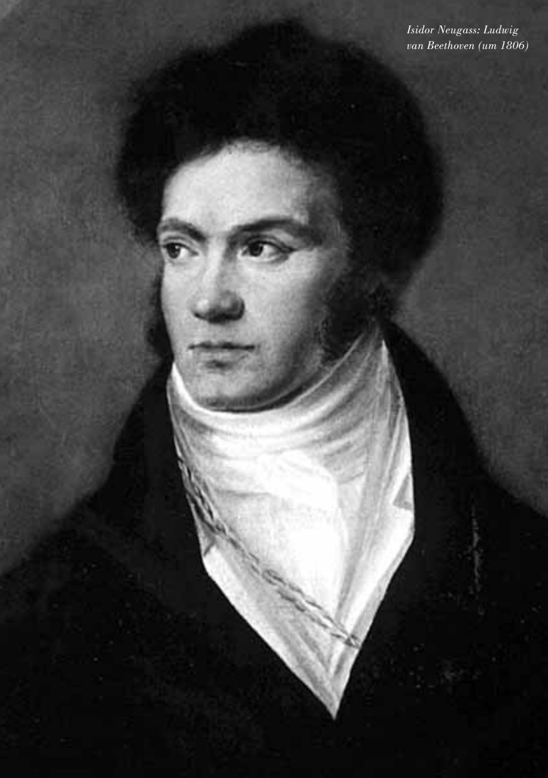
Isidor Neugass: Ludwig van Beethoven (um 1806)