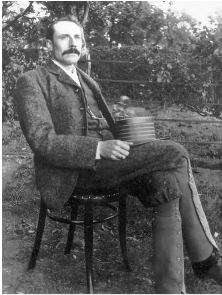
EDWARD ELGAR UM 1895 (ANZUG UND HUT HATTE SICH DER PASSIONIERTE BAYERN-LIEBHABER IM JAHR ZUVOR IN MÜNCHEN GEKAUFT)